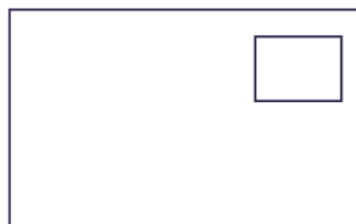
橫式作品黏貼位置